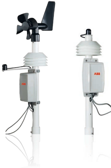
ABB monitoraggio e comunicazione VSN800 Weather Station

La VSN800 Weather Station monitorizza automaticamente le condizioni atmosferiche del sito e la temperatura del pannello fotovoltaico in tempo reale trasmettendo le misurazioni effettuate dai sensori ad Aurora Vision® Plant Management Platform.